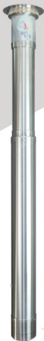
けむりフード10(テン) ロングタイプ