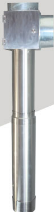
けむりフード8(エイト) 2WAY ボックス装着 (オプション)

高性能グリスフィルター「アポロ3」を標準装備。 においも煙も残さない。 店内の空気はいつもフレッシュなまま。