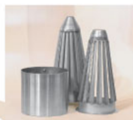
ステンレス製グリスフィルター「アポロ3」 (特許取得済 特許第4506851号、意匠登録済)