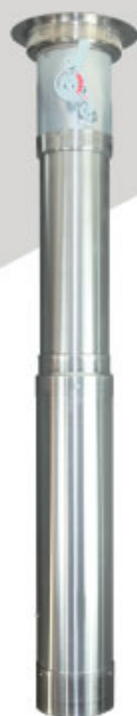
けむりフード10(テン) ショートタイプ