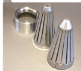
ステンレス製グリスフィルター「アポロ3」 (特許取得済 特許第4506851号、実用登録済)

高性能グリスフィルター「アポロ3」を標準装備。 においも煙も残さない。 店内の空気はいつもフレッシュなまま。